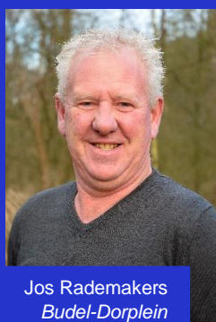
Jos Rademakers Budel-Dorplein